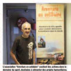
L'association 'Aventure en Solidaire' soutient des actions dans le domaine du sport, d'entraide à l'écoute des projets humanitaires.